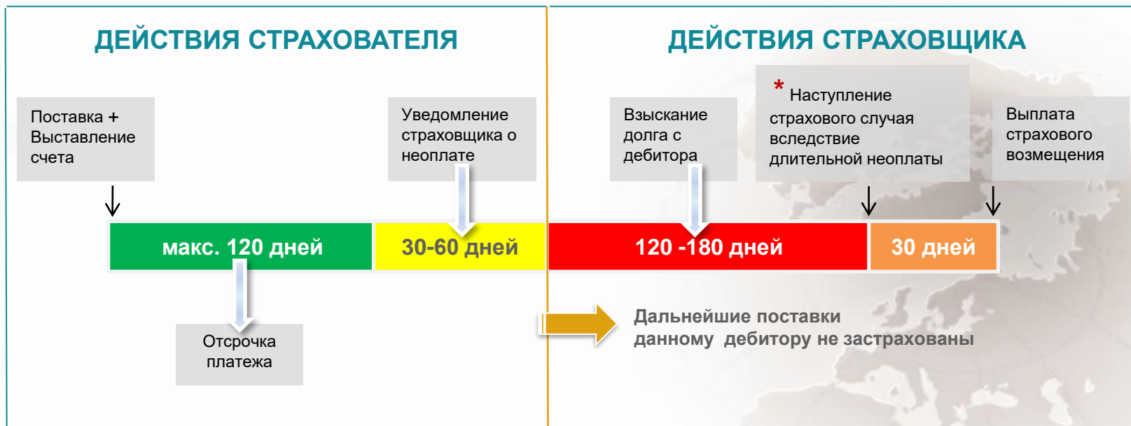
Схема страхования торговых кредитов

* В случае банкротства покупателя страховой случай наступает в момент предоставления страховщику соответствующего документа, подтверждающего факт банкротства дебитора